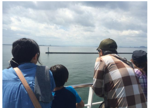
デッキからの風景