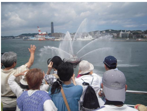
消防艇による歓迎放水