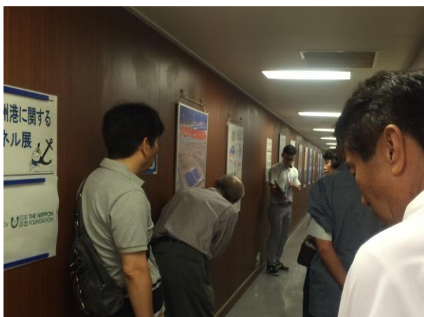
北九州港に関するパネル展