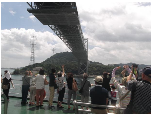
関門橋を見上げる乗船者たち