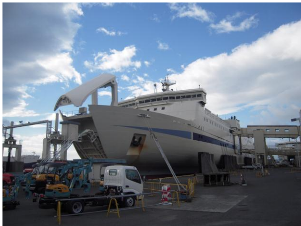
乗船を待つ「つくし」